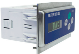
PTPN 어댑터 플레이트가 있는 IND331