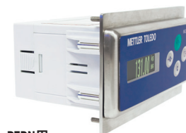
PTPN用 アダプタプレート付きIND331

*Class 1 (cyclic) およびClass 3 (discrete) またはexplicitメッセージ送信に対応可